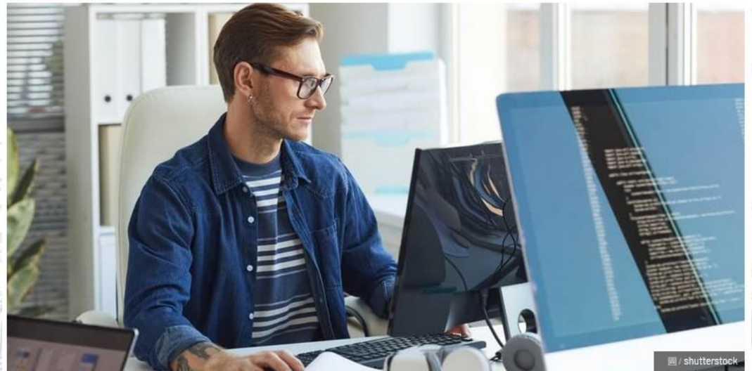
圖 / shutterstock